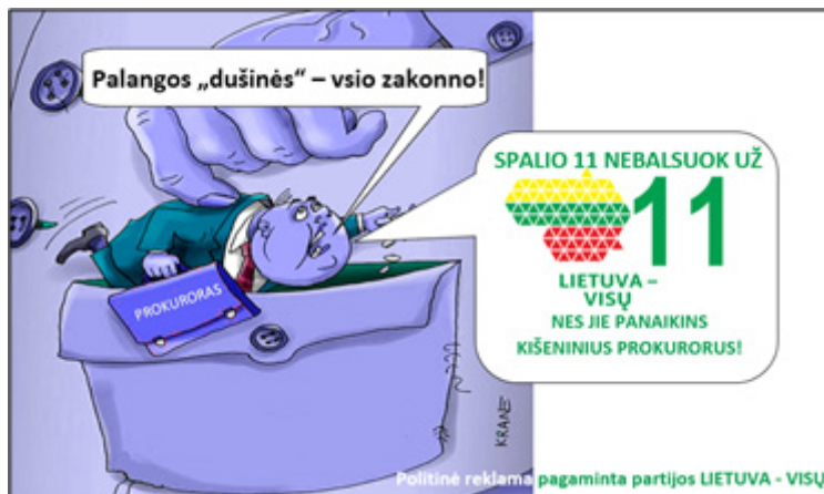
2 pav. Politinė partijos „Lietuva – visų“ reklama, skirta 2020 m. vykusiems LR Seimo rinkimams