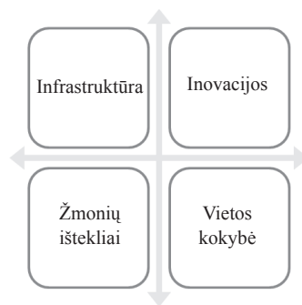
2 pav. Bibliotekos vertinimo kriterijai

Šiame tyrime laikomasi supratimo priegos pozicijų, nes pateikiami asmeniniai publikacijos autorių požiūriai į bibliotekų veiklos vertinimo kriterijus. Tam, kad vertinimo rezultatai būtų panaudojami, vertinimo kriterijai turi būti informatyvūs bibliotekos profesionalams ir turėti pageidaujamą poveikį jų darbui. Šiame tyrime nagrinėjami keturi vertinimo kriterijai tam tikroms auditorijoms yra naudingi (2 pav.).