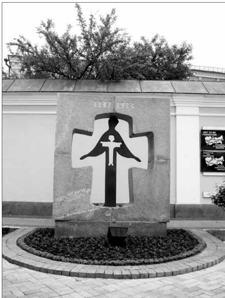
1 pav. Memorialinis paminklas Holodomoro aukoms. Kyjivas, Mykhailivska aikštė.

2008 m. Kijevo centre atidarytas Nacionalinis Holodomoro ir genocido muziejus. Muziejaus pastatas yra žvakės formos. Priešais jį stovi bronzinė mergaitės su kviečių varpomis skulptūra „Kartūs vaikystės prisiminimai“. V. Juščenkos prezidentavimo laikotarpiu buvo suformuotos oficialios Holodomoro aukų atminimo įamžinimo ceremonijos ir ritualai: pastatyti kryžiai, rengtos viešos pamaldos, išleistos atminimo knygos. Atminimo apeigų simboliai buvo kryžius, motina ir vaikas(-ai), rankos, angelas, varpas, apskritimas 21 , kviečių varpos ir putino kekės. Holodomoro aukų atminimo dieną 16 val. tylos minute pagerbiamos