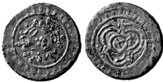
Skaičiavimo žetonas aversas ir reversas

Vienas pirmųjų šios in folio formato knygos savininkų nėra žinomas, tačiau, spėjama, gyvenęs XVI amžiuje. Priešlapyje jis paliko tekstą lotynų kalba bei gausias pastabas, komentarus veikalo paraštėse bei pačiame jo tekste. Inkunabulas įrištas XVI amžiuje – tai atskleidžia šiam laikotarpiui būdingi viršelio