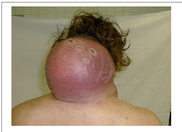
1 pav. Gigantinė infekuota lipoma kaklo užpakaliniam paviršiuje