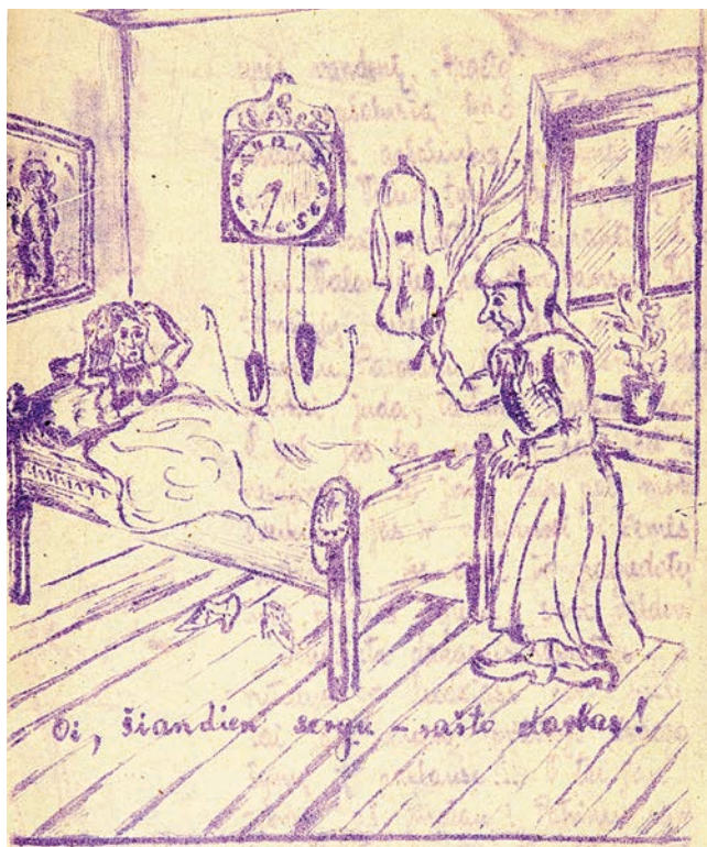
3 il. Karikatūra iš laikraščelio Mokinių žingsniai (Viekšnių vidurinė mokykla), 1930, nr. 6

Aut. nežinomas / Lietuvos nacionalinė Martyno Mažvydo biblioteka, C1 RK F135-647 07/28520