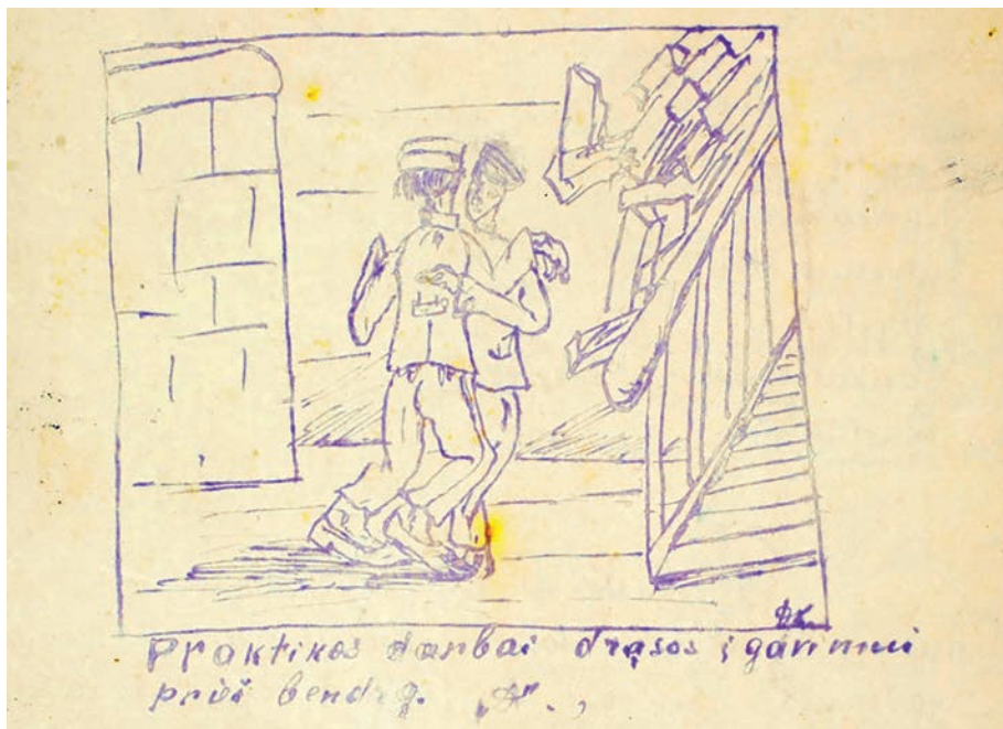
5 il. Karikatūra iš laikraščelio Mokinių mintys (Viekšnių vidurinė mokykla), 1926, nr. 3

Aut. D. K. / Lietuvos nacionalinė Martyno Mažvydo biblioteka, C1 RK F135-637 07/27382