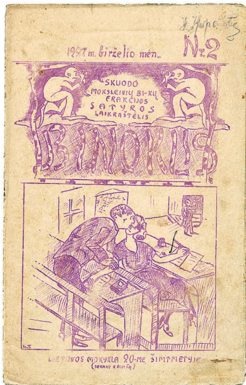
6 il. Karikatūra iš satyros laikraščelio Binoklis (Skuodo moksleivių akcinė b-vė „Meilė“), 1927, nr. 2

Aut. L. T. / Lietuvos nacionalinė Martyno Mažvydo biblioteka, C1 RK F135-167 07/3885