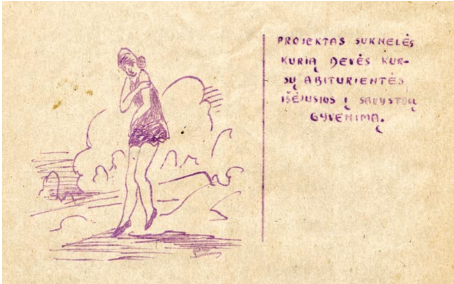
7 il. Karikatūra iš satyros laikraščelio Binoklis (Skuodo moksleivių akcinė b-vė „Meilė“), 1927, nr. 2

Aut. nežinomas / Lietuvos nacionalinė Martyno Mažvydo biblioteka, C1 RK F135-167 07/3885