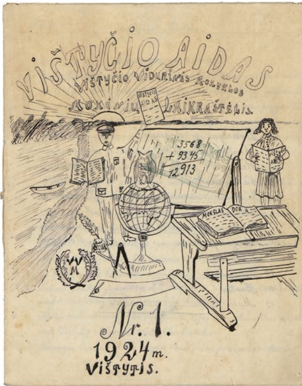
1 il. Laikraščelio Vištyčio aidas viršelis (Vištyčio vidurinė mokykla), 1924 m., nr. 1

Aut. nežinomas / Lietuvos nacionalinė Martyno Mažvydo biblioteka, C1 RK F135-1401 08/18038