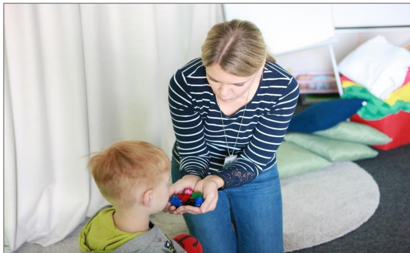
Bibliotekos darbuotojai kvalifikuotai padeda įveikti nerimą ir jaukiai jaustis bibliotekos erdvėje