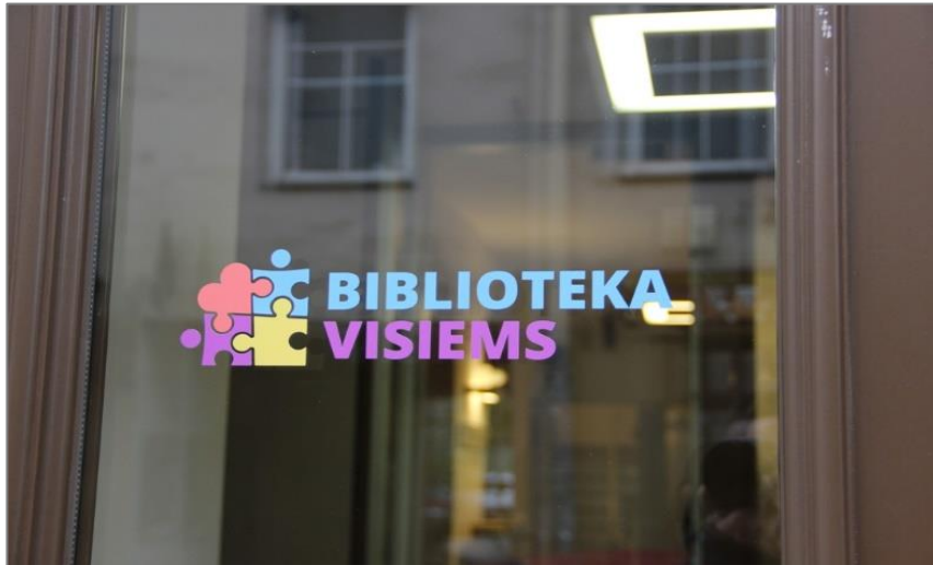
Lietuvos viešųjų bibliotekų duris papuošė išskirtinis ženklas – spalvota dėlionė „Biblioteka visiems“

Naujausi didelės apimties apklausų rezultatai rodo, kad autizmo spektro sutrikimas būdingas 1–2 proc. gyventojų. Lietuvoje, kaip ir visame pasaulyje, autizmo atvejų daugėja. Autizmo spektras labai platus, vis dėlto dažniausios probleminės sritys yra socialinė sąveika, kalbinis ir nekalbinis bendravimas, pasikartojantis elgesys ir riboti pomėgiai. Visgi, kaip rodo tyrimai, asmenys, turintys autizmo spektro sutrikimų, biblioteką įvardija kaip puikią relaksacijos, edukacijos ir bendraminčių susibūrimo vietą. Apie 90 proc. apklaustųjų teigia, kad bibliotekose lankytųsi dažniau, jeigu šios pritaikytų savo fizinę aplinką. Tai, kad Lietuvos bibliotekos tampa dar labiau draugiškos žmonėms, turintiems autizmo spektro sutrikimų, – didelis žingsnis pirmyn, teikiantis vilties, kad gražiu pavyzdžiu paseks ir kitos viešosios įstaigos.