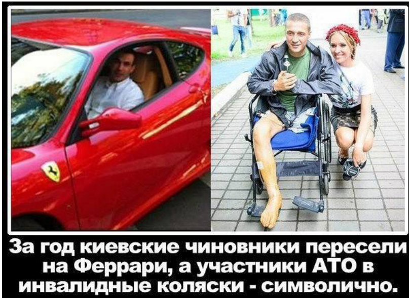
1 pav. Facebook: Remembers

Kita pusė – Kijevo gyventojai įkeliamos nuotraukos siekiant pavaizduoti skirtumus. Vaizduojami prabangūs automobiliai, kuriuose rašoma, kad Kijevas perėmė vakarietišką kultūrą. „Remembers“ puslapyje pristatomas įrašas su dviem nuotraukomis. Vienoje pusėje – vyras vairuojantis prabangų automobilį, o kitoje nuotraukoje – vyras neįgaliojo vežimėlyje be vienos kojos, šalia vėžimėlio priklaupusi mergina. Įrašas nuotraukoje su provokuojančiu užrašu: „Per metus Kijevo pareigūnams pavyko atsistėti į Ferrari automobilius, o ATO kareiviui – į invalido vežimėlį“. Tai pristatoma kaip didžiausia neteisybė, norima parodyti aukštą korupcijos lygį. Nuotrauka primityviai suklastota, asmenys nuotraukoje paimti iš kito konteksto. Siekis išprovokuoti skaitytoją, sukelti pasipiktinimą, neteisybės jausmą.