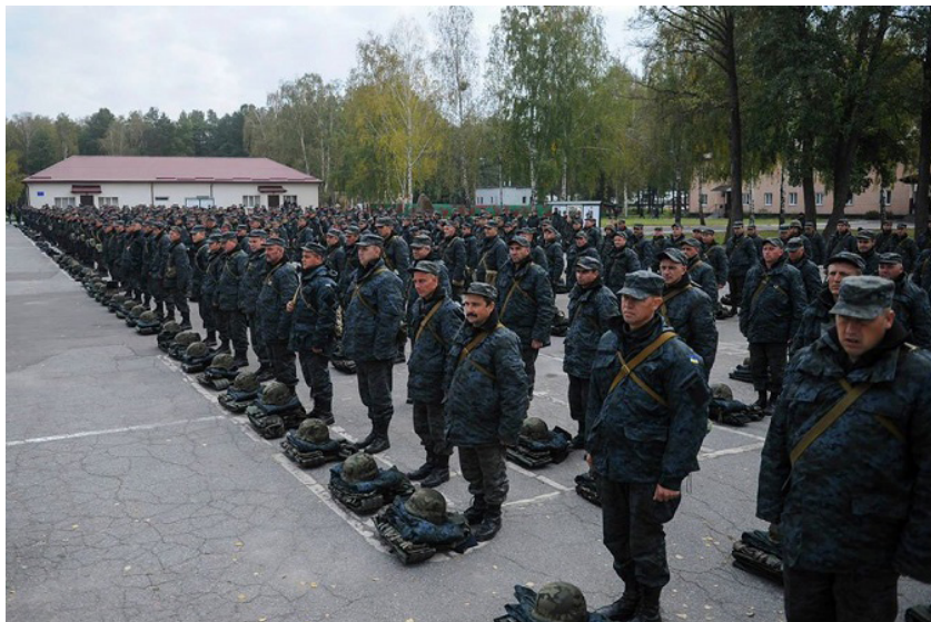
8 pav. Facebook: Bürgerinitiative für Frieden in der Ukraine

Toliau pateikiamos nuotraukos su nacistine simbolika, kuri vaizduojama ant asmenų, vilkinčių karinę uniformą. Nuotraukos neaiškios, asmenų, pavaizduotų nuotraukose, faktiškai neįmanoma susieti su Ukrainos kariuomene. Vienoje nuotraukoje matyti dalis geltonos vėliavos, kuria siekiama suklaidinti vartotojus, kad nuotraukoje – Ukrainos kariuomenė. Nuotraukos apačioje užrašas pateiktas anglų kalba: „Ukrainos nacių kariuomenė dalyvavo masinėse žudynėse, kurių rėmė Vakarų fašistinė žiniasklaida Vakarų ES, NATO ir JAV fašistinės vyriausybės“.