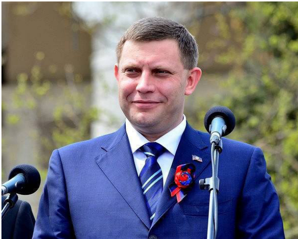
5 pav.

Separatistinės Donecko liaudies respublikos vadas Aleksandras Zaharčenko (1976 – 2018) sveikina musulmonus su jų švente. Jo žodžiais, Donbaso musulmonai visada vaidino svarbų vaidmenį kuriant tarptautinę taiką ir tarptautinį supratimą ir labai prisidėjo prie Donecko liaudies respublikos plėtros. Ši diena A. Zaharčenko žodžiais išreiškia tikrąsias islamo vertybes: labdara, moralinis grynumas ir rūpestis. Jis tikisi, kad Donecko liaudies respublikos musulmonų bendruomenė toliau skatins tarptautinėje šalyje gyvenančių tautų draugystės ir supratimo plėtrą ir stiprinimą. A. Zaharčenko, kaip ir V. Putino, nuotrauka atspindi neutralumą, ramybę ir pasitikėjimą. Jis kreipiasi į musulmonų bendruomenę palaikymo per sveikinimo žodį.