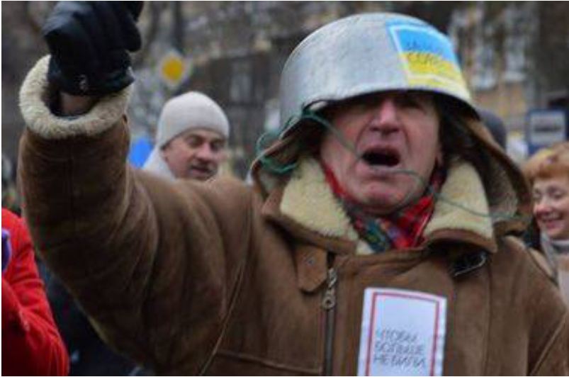
12 pav. Facebook : Bürgerinitiative für Frieden in der Ukraine

Publikuojama nuotrauka grupės asmenų su kaukėmis, kurioje matyti tam tikra Ukrainos simbolika, vėliava. Nuotraukoje asmenys sutapatunami su „Euromaidano“ protestuotojais. Prie nuotraukos – įrašas, kurioje rašoma apie išaugusias vagystes ir išpuolius prieš žydų bendruomenės narius. Nuotrauką ir įrašą bandoma sugretinti, kad Facebook vartotojas pagalvotų apie nuotraukoje esančius asmenis, kurie ir atlieka aprašytus veiksmus. Taip siekiama sukompromituoti „Euromaidano“ protestuotojus, patvirtinti jų skleidžiamą argumentą, kad valdžioje įvyko perversmas ir valdžią užėmė fašistinė grupuotė.