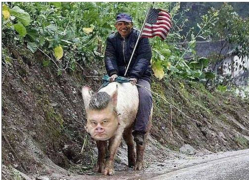
21 pav. Facebook: Remembers

Kitame meme tęsiamas siekis pažeminti Ukrainos Prezidentą P. Porošenką. Žiūrovui siūloma įsivaizduoti, kad Porošenka turi kiaulės snukį, o ant jo viršaus atsisėdęs JAV Prezidentas Barakas Obama su JAV vėliava. Kiaulės motyvas yra labai stiprus, jis simbolizuoja išdavystę, nešvarą. Taip siekiama sukelti neigiamus jausmus, sumenkinti pasitikėjimą.