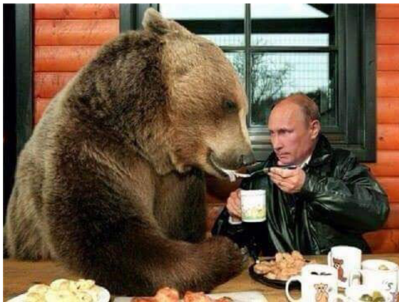
24 pav. Facebook: VoiceDonbass

Dar viename meme, kuris pavadintas „sankcijų teatras“, siekiama išjuokti Vakarų taikomas Rusijai sankcijas. Rusijos lyderis Putinas stebi, kaip JAV prezidentas Obama valdo Ukrainos prezidentą P. Porošenką ir Vokietijos kanclerę A. Merkel, kurie 2014 m. pritaikė sankcijas Rusijai. Įrašė aprašoma, kad Rusijos prezidentas naujas ES sankcijas Rusijai pavadino mažai veiksmingomis ir reikšmingomis. Pasak jo, jos niekada neatneš norimų rezultatų tokiai valstybei kaip Rusija. Meme menkinama Ukraina ir Vokietija, kurios esą vykdo JAV pavestą politiką. Ukrainos vyriausybė vadinama fašistais, vykdančiais genocidą Donbasse. Ši nuotrauka yra Rusijos informacinio karo strategijos įgyvendinimo įrankis, įamžinantis neigiamus Ukrainos, ES ir NATO sąjungininkų įvaizdžius, tuo pačiu sustiprinant teigiamą Rusijos įvaizdį. Ji klaidina ir sumenkina oponentų autoritetą, žemina juos, o Rusijos šalininkus neva skatina, mobilizuoja ir nuramina.