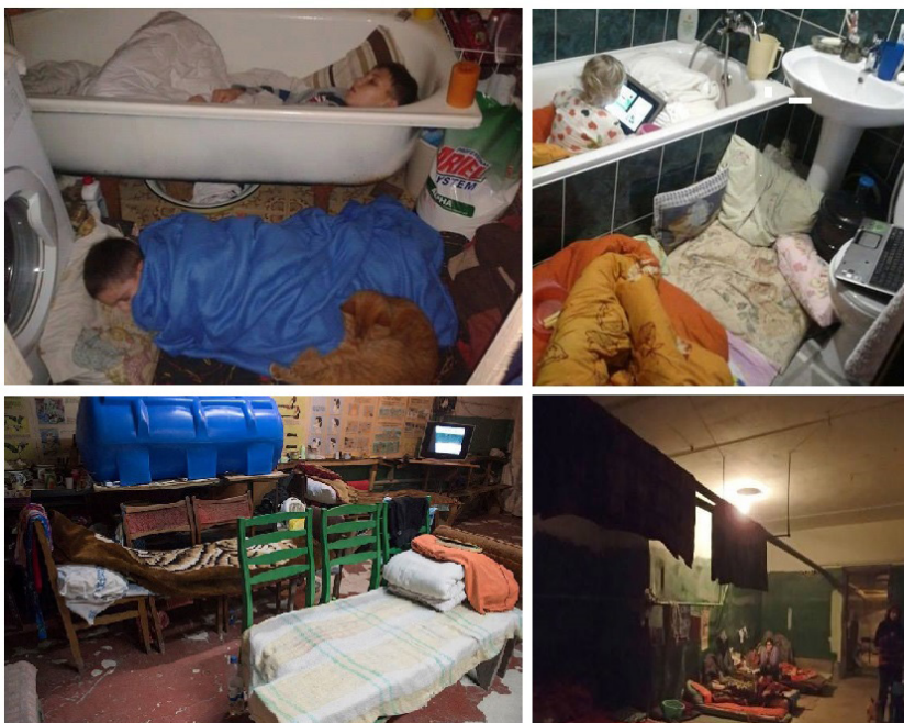
2 pav. Facebook: Bürgerinitiative für Frieden in der Ukraine

Kitame pavyzdyje pristatomi nepagrįsti faktais skaičiai, kad esą 60.000 Ukrainos civilių turėjo prarasti gyvybes antiteroristinėje operacijoje. Įrašė pabrėžiama apie Donbase vykdomą genocidą, kuris iki šiol neva nesibaigia. Įrašė pabrėžiama, kad šias teroristines atakas įvykdė „fašistinė Ukrainos vyriausybė su NATO ir JAV pagalba“. Kaltinami Vakarai ir Ukrainos vyriausybė, kuri pavertė oligarchus dar turtingesniais, vargšus – dar labiau nepasiturinčiais. Įrašuose pabrėžiama Vakarų iniciatyva, karo provokacija ir Kijevo valdžios naudos siekimas iš karo. Dažniausiai nuotraukų įrašuose minimas „Donbaso genocidas“. Formuojama takoskyra tarp Vakarų ir Rytų Ukrainos. Vakariais vadinamas Kijevas, o rytais – Donbasas. Nuotraukos, faktai ir skaičiai pateikti be šaltinio ir autoriaus.