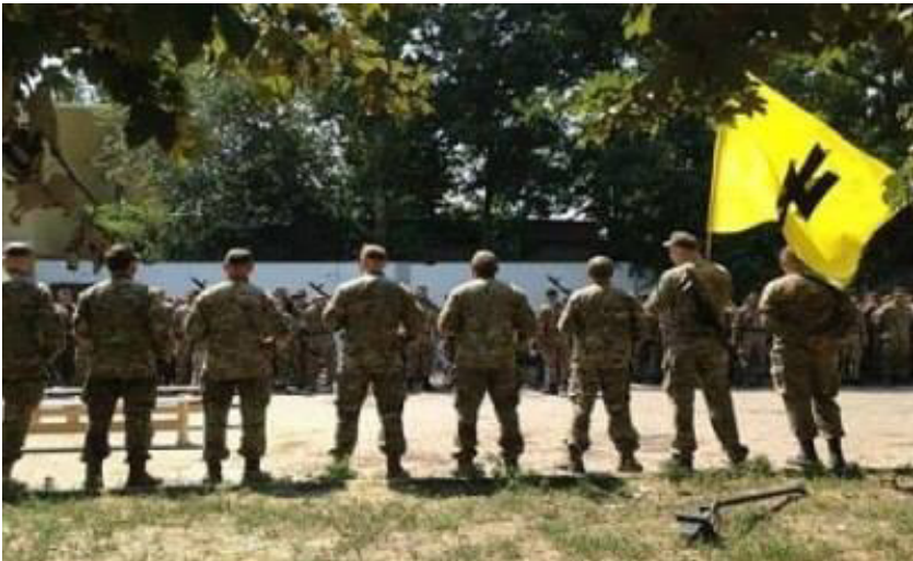
10 pav. Facebook : Antimaidan + Sage Nein zu Faschismus

yra sustabdomi naudojant jėgą. Kuriamas įvaizdis, kad šalį okupavo Ukrainos nacių režimas. Teigiama, kad šis interviu buvo pateiktas telefonu per „Pirmąjį“ Rusijos kanalą, tačiau vaizdo įrašo nėra. Nuotrauka pateikta su nacistinė simbolika, galimai sumontuota. Ukrainos valdžia, kariuomenė ir milicija pristatomi kaip fašistai, naciai, kurie eina prieš civilius gyventojus. Kariuomenė pristatoma kaip agresorius siekiant suklaidinti Facebook vartotojus Vokietijos erdvėje.