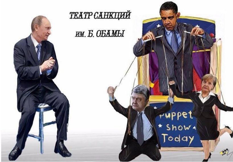
25 pav. Facebook: Remembers

Taigi socialiniame tinkle Facebook formuojamas neigiamas Ukrainos įvaizdis naudojant įvairius auditorijoms atpažįstamus simbolius ir sąmoningai pateikiant vartotojus klaidinančią informaciją.