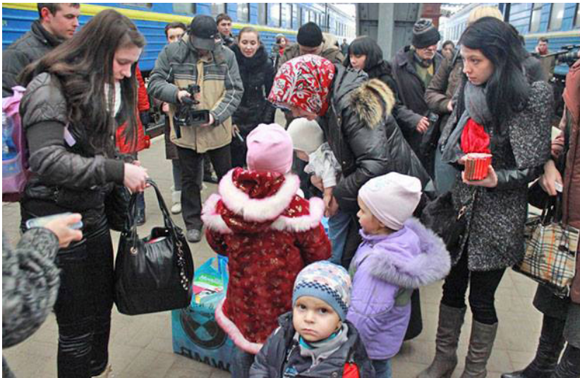
3 pav. Facebook: Bürgerinitiative für Frieden in der Ukraine

Kita ne mažiau akcentuojama tema – civilių karo kaip pabėgėlių vaidmuo. Civiliai bėga iš Ukrainos, t.y. iš Donbaso regiono į Rusiją, prašo pagalbos ir prieglobsčio Rusijoje. Įkeliamas įrašas su nuotrauka, kurios pavadinimas: „Tūkstančiai ukrainiečių bėga iš Donbaso į Rusiją“. Įrašė rašoma, kad ukrainiečiai dėl Kijevo režimo vykdomos engimo politikos prieš Donbaso gyventojus priverstė palikti Ukrainą ir bėgti į Rusiją. Įrašė nurodoma, kad pabėgėlių srautas į Rusiją vėl išaugo ir Rusija organizuoja saugų prieglobstį moterims ir vaikams. Pateikiama nuoroda į rusišką naujienų portalą, tačiau jį atidarius puslapyje nukreipiama į pradinį svetainės puslapį, kuriame tokia žinutė neegzistuoja. Rusija vaizduojama kaip valstybė didvyrė ir gelbėtoja, suteikianti humanitarinę paramą ir prieglobstį ukrainiečiams. Ukraina vaizduojama kaip žlunganti valstybė, kurioje esą vyrauja korupcija, valdo kančia ir chaosas.