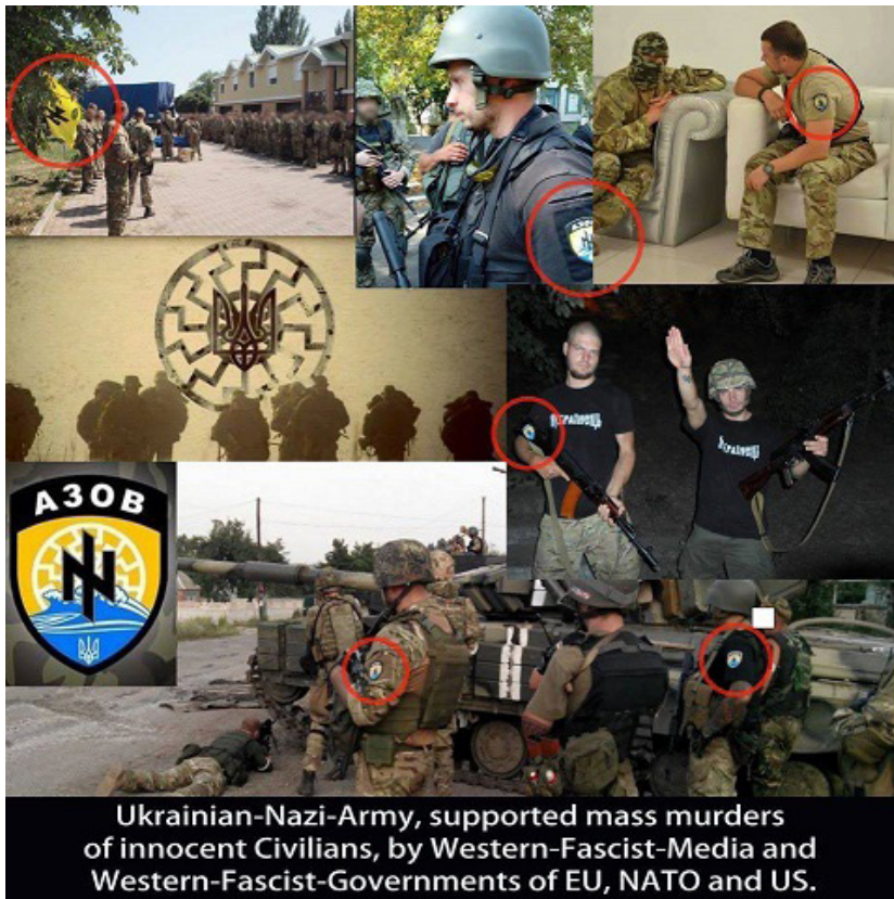
9 pav.

Nuotraukose vaizduojama Ukrainos kariuomenė kaip „chunta“, „fašistai“, „naciai“, arba kaip dažnai minimi radikalūs nacionalistai. Norint sustiprinti poveikį, Ukrainos kariai dažniau vaizduojami kaip pasirengę kovoti, atliekantys veiksmus, kurie sukelia netikrumą, baimę ir kančią. Puslapyje „Antimaidan+Sage Nein zu Faschismus“ pasidalinta nuotrauka ir įrašų, kaip „chuntos“ pagalbininkai Nikolajavo mieste baugina, kankina ir grobia nelojalius Ukrainos valdžiai gyventojus. Įrašė teigiama, kad nėra prasmės skųstis milicijai, kadangi įsakymai iš valdžios ateina milicijai, o bet kokie mitingai prieš Kijevo „chuntos“, nacių režimą