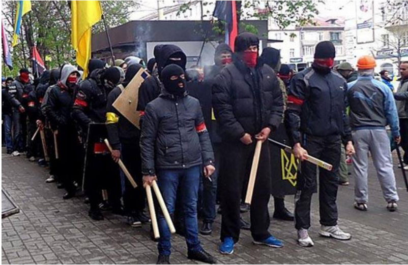
13 pav. Facebook: Bürgerinitiative für Frieden in der Ukraine