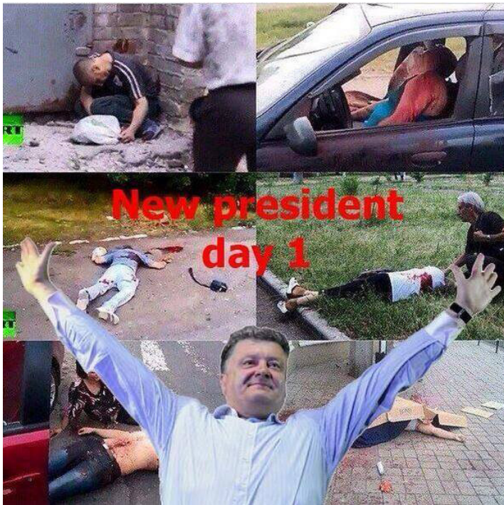
20 pav.