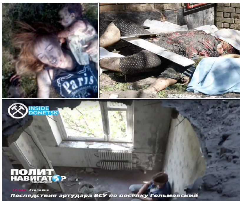
14 pav. Facebook: Remembers