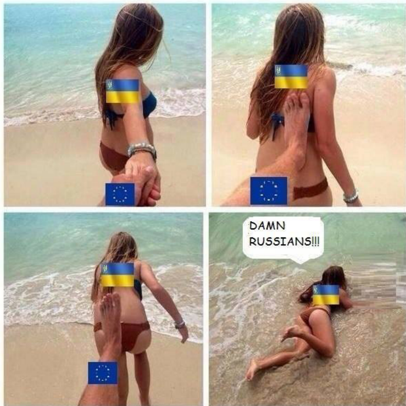
22 pav. Facebook: Bürgerinitiative für Frieden in der Ukraine

krenta į vandenį. Taip vaizduojama neva išdavystė, veidmainiškumas, žeminantis ES elgesys su Ukraina. Norima pažeminti Ukrainos orumą ir žmogiškumą.