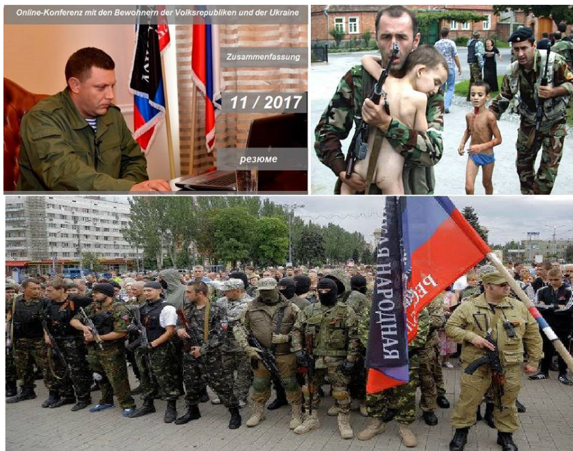
6 pav. Facebook: VoiceDonbass ir Bürgerinitiative für Frieden in der Ukraine

Separatistų kariai nėra gausiai vaizduojami Facebook socialiniame tinkle. Daugiau randama separatistų lyderių nuotraukų. Dažniausiai jie vaizduojami kaip atliekantys veiksmą: dalyvaujantys minėjime, kovojantys ar gelbėjantys civilius. Jie pristatomi kaip lyderiai ir gelbėtojai, o nuotraukos paaimamos iš kito konteksto (Gruzijos, Sirijos ir kt.) ir pritaikomos esamiems įvykiams.