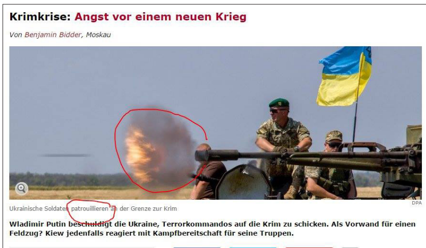
16 pav. Facebook : „RT Deutsch“

Kitas pavyzdys – „RT Deutsch“ Facebook puslapyje. Patalpinta straipsnio nuotrauka, kurioje nurodoma, kad ji paimta iš „Spiegel Online“. Straipsnio pavadinimas: „Baimė prieš naują karą“. Nuotraukoje raudonai apvestas tanko šūvis ir po nuotrauka – paaiškinimas: „Ukrainos kariai patruliuoja prie Krymo sienos“. „RT Deutsch“ įrašė prie nuotraukos komentuoja: „Ukrainos kariai patruliuoja pasienyje prie Krymo. Nuostabu...“ Įkelta nuoroda į rusišką straipsnį apie sutrukdytą teroristinį išpuolį, kurio metu esą sulaikyti Ukrainos slaptosios tarnybos darbuotojai. Straipsnyje rašoma, kad Ukrainos Prezidentas Porošenka neigė rengiantis teroristinius išpuolius Kryme ir pabrėžė, kad Kijevas pasmerkė terorizmą visomis jo formomis. Taip pat nurodoma, kad pasienyje su Krymu ir Donbasu dislokuota Ukrainos kariuomenė, pasirengusi kariauti.