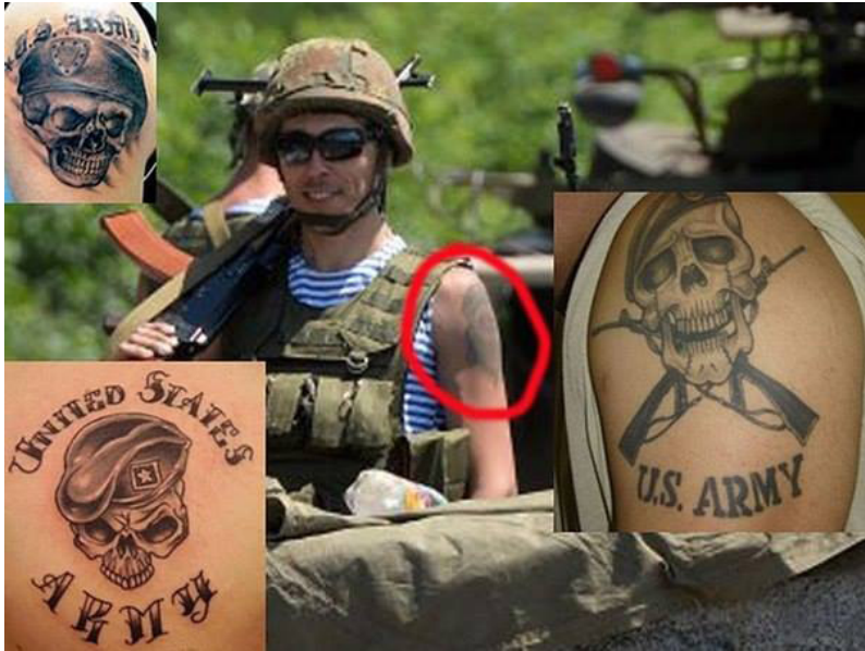
11 pav. Facebook: Save Donbass People from Ukrainian Army German