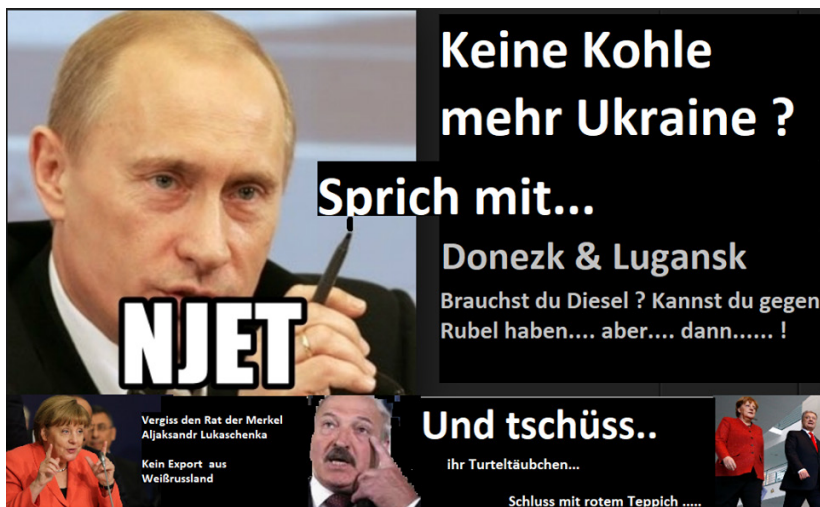
23 pav.

pamiršti Aliksandrą Lukašenką, daugiau jokio eksporto iš Baltarusijos“, o prie A. Lukašenkos parašyta: „Iki, mano balandėle“. Naudojamas imperialistinės Rusijos modelis, kuriame V. Putinas atlieka svarbiausią lyderio vaidmenį. Jo pareiga esą yra sukurti naujojo pasaulio tvarką, jis priima svarbius sprendimus: kas gali su kuo bendradarbiauti, o kas – ne. Jis esą gina įvairių tautų teises, teisę į demokratiją, žmogaus teises, jis – prieš vakarietiškas vertybes: „Rusija daugiau neteiks Vakarams naudingų iškasenų, dyzelino, kuriuo važinėja Ukrainos tankai ir žudo brolius Donbase.“ Rusija pristatoma kaip laisvės ir demokratijos simbolis.