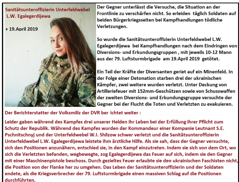
19 pav. Facebook: Voicedonbass