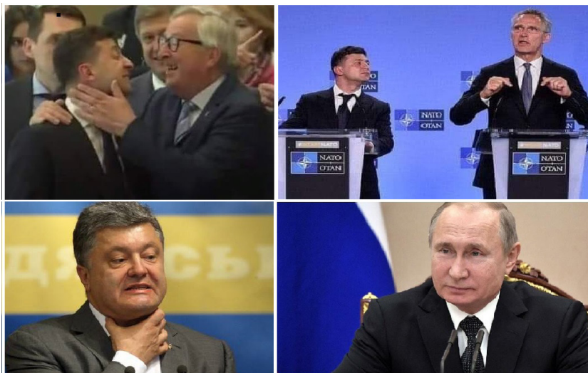
4 pav. Facebook : Bürgerinitiative für Frieden in der Ukraine

Politikų fotografijos socialiniame tinkle Facebook stipriai išraiškin- gos: teigiamos arba neigiamos. Vienareikšmiškai Ukrainos, JAV, ES politikai vaizduojami neigiamai, o Rusijos ir separatistų lyderiai vaiz- duojami teigiamai. Ukrainos politikų nuotraukos būna pateikiamos iš užsienio vizitų, kuriose vaizduojamas didelis draugiškumas Vakarų užsienio valstybėms, vertinamas neigiamai. Ukrainiečių politikai va- dinami užsienio agentais, parsidavėliais ir tai vaizduojama nuotrauko- se. Vokietijos kanclerė Angela Merkel pateikiama kaip JAV tarpininkė Europoje. Įkeliamos nuotraukos pasižymi stipria emocija: užuojautos nebuvimas, savanaudiškumas, naivumas. Rusijos politikus reprezen- tuojančiose nuotraukose atsispindi Vladimiro Putino kultas, kuriose jis yra vaizduojamas kaip esą teigiamas, ramus, suteikiantis pasitikėjimą ir profesionalumą. Nuotraukos puslapiuose paimtos ir patalpinta iš rusiš- kų naujienų portalų.