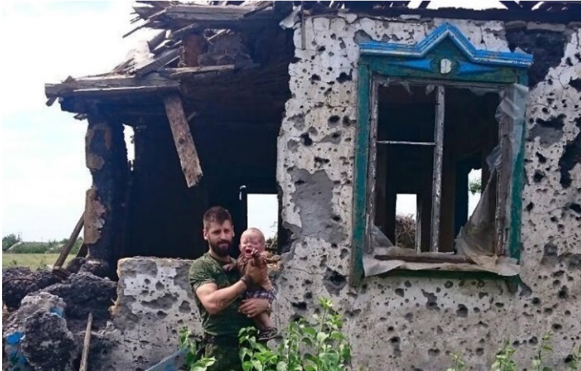
7 pav. Facebook: Remembers

baigtūsi“. Nuotrauka įkelta 2015-06-15, praėjus daugiau nei metams nuo konflikto pradžios. Nuotraukoje siekiama parodyti Donbaso gyventojus nukentėjus nuo Ukrainos, kurie esą buvo išgelbėti, o separatistų kariai – kaip gelbėtojai-išlaisvintojai.